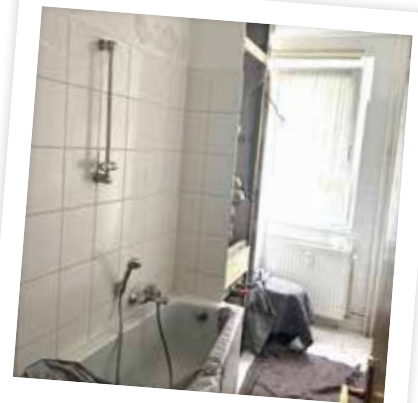
Strangsanierung aller Versorgungsleitungen

In enger Zusammenarbeit mit unseren langjährigen Partnern und Handwerksbetrieben ist es uns gelungen, die Wohnungen auch im zurückliegenden Jahr innerhalb kürzester Zeit in einen modernen Zustand zu versetzen, die unseren neuen Genossenschaftsmitgliedern ein neues Zuhause bieten, in dem sie sich wohlfühlen und heimisch fühlen können.