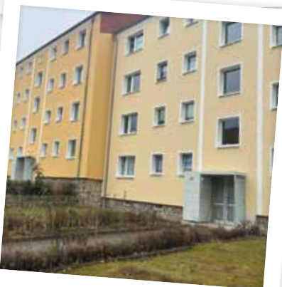
in der Pößnecker Straße