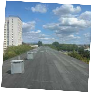
Sanierung des Flachdaches Friedrich-Engels-Straße