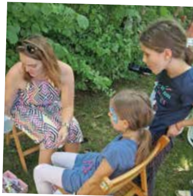
Spaß für Groß und Klein