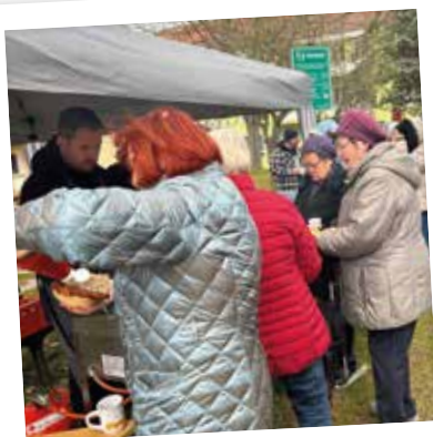
Für Speis und Trank war gesorgt