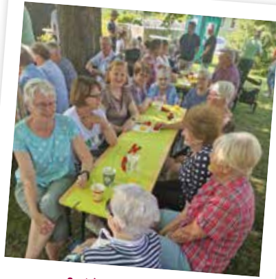
...in fröhlicher Gemeinschaft